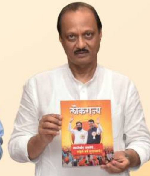
अजित पवार उपमुख्यमंत्री