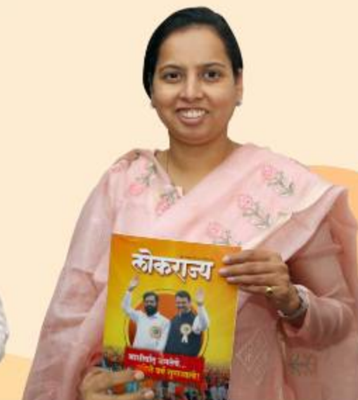
अदिती तटकरे मंत्री, महिला व बाल विकास